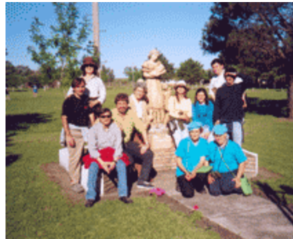
GUIAS DEL LUGAR CON GRUPO DE TUISTAS