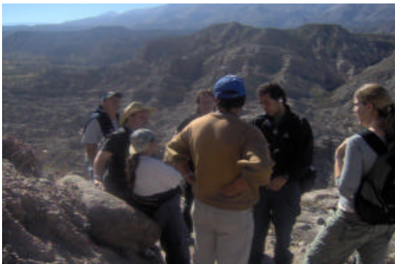
RECONOCIENDO ATRACTIVOS, ASCENDIENDO A CIUDAD INDIGENA

El proyecto involucra como beneficiarios directos, a 15 familias.