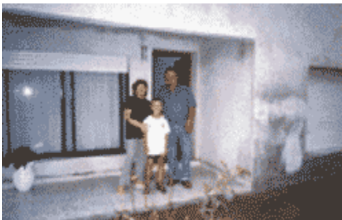
FAMILIA QUE OFRECE SU CASA COMO ALOJAMIENTO

El proyecto involucra como beneficiarios directos, a 15 familias relacionadas con la nueva actividad turística.