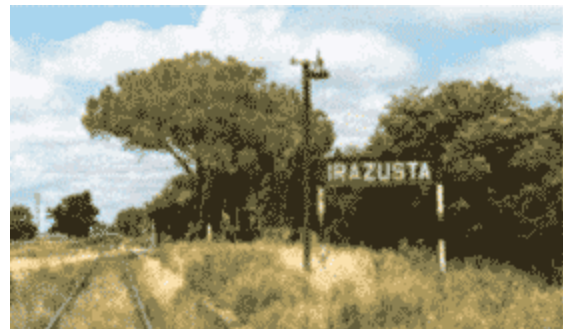
VISTA DESDE LA ESTACIÓN DE FERROCARRIL