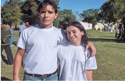
DOS GUIAS DEL CIRCUITO NATURAL, EL DIA DE LA INAUGURACION DEL PUEBLO.

Los jóvenes de Godoy y de Morante son los principales protagonistas de estos proyectos.