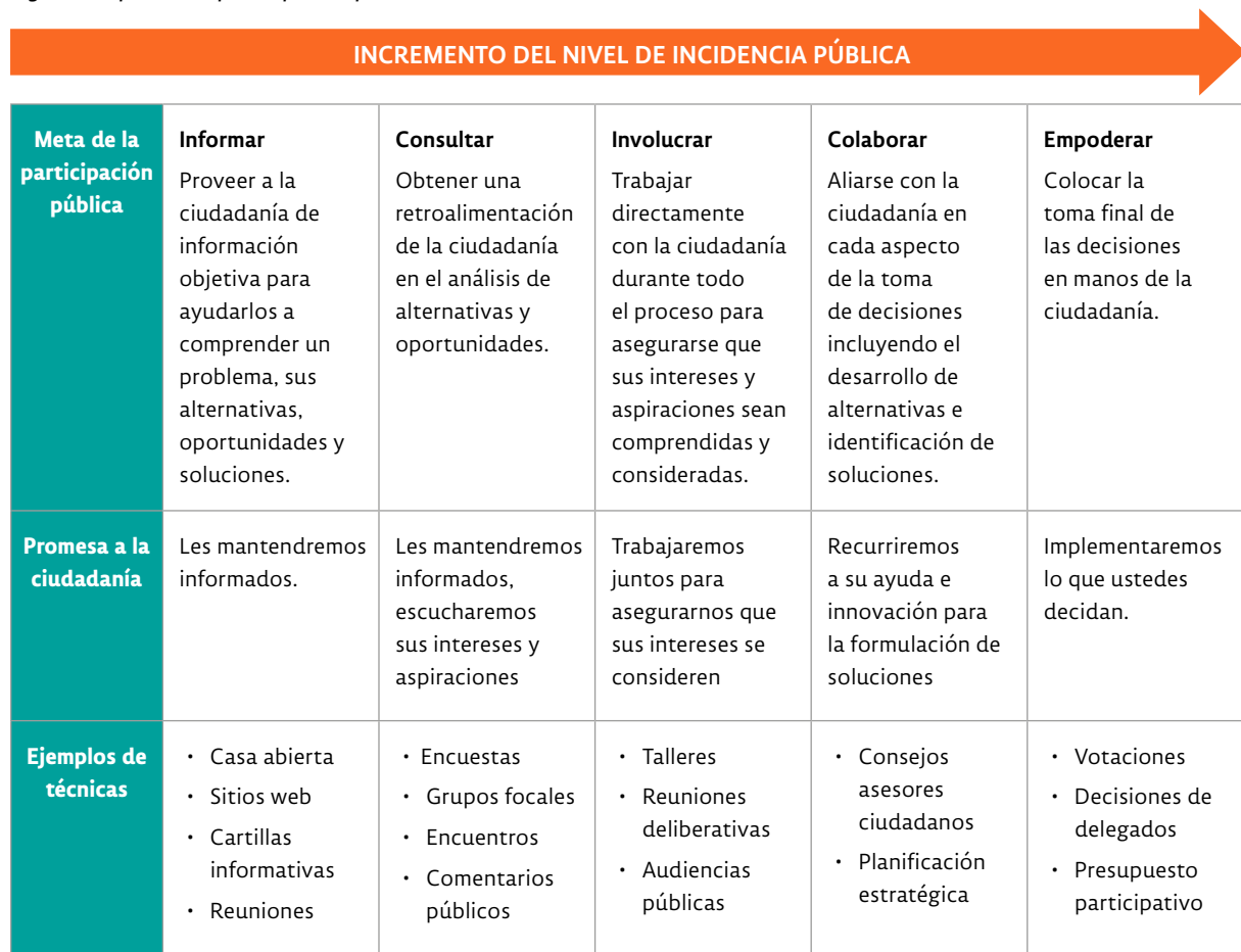
Figura 1. Espectro de participación pública de la IAP2

la decisión. Los niveles de participación van desde la no influencia, que se da por ejemplo en ámbitos meramente informativos, hasta el empoderamiento de la ciudadanía, que sucede en aquellos ámbitos donde ésta tiene la decisión final.