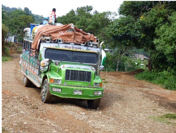
Foto: El transporte es colectivo- la escalera

Las tulpas en la comunidad de Las Delicias han trabajado el concepto de educación como algo integral que proviene desde la misma educación familiar donde se debe incluir los valores culturales ancestrales: “Desde el fogón tenemos que orientar a los hijos y nietos ya que anteriormente el fogón era la mejor educación que se recibía de los abuelos y padres”. Se deben fortalecer los valores familiares en la comunidad, inculcar el valor de la cultura, el idioma propio debe promoverse desde la escuela con profesores que hablen Nasa Yuwe.