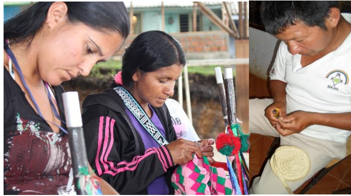
Foto: Manual de producción sostenible de café en Las Delicias, 2016

Las tulpas en la comunidad de Las Delicias han trabajado el concepto de educación como algo integral que proviene desde la misma educación familiar donde se debe incluir los valores culturales ancestrales: “Desde el fogón tenemos que orientar a los hijos y nietos ya que anteriormente el fogón era la mejor educación que se recibía de los abuelos y padres”. Se deben fortalecer los valores familiares en la comunidad, inculcar el valor de la cultura, el idioma propio debe promoverse desde la escuela con profesores que hablen Nasa Yuwe.