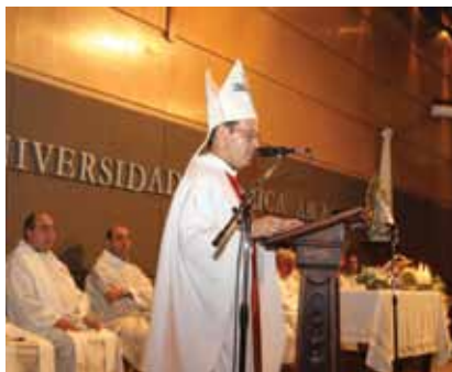
El Obispo de San Rafael pronuncia la Homilía.