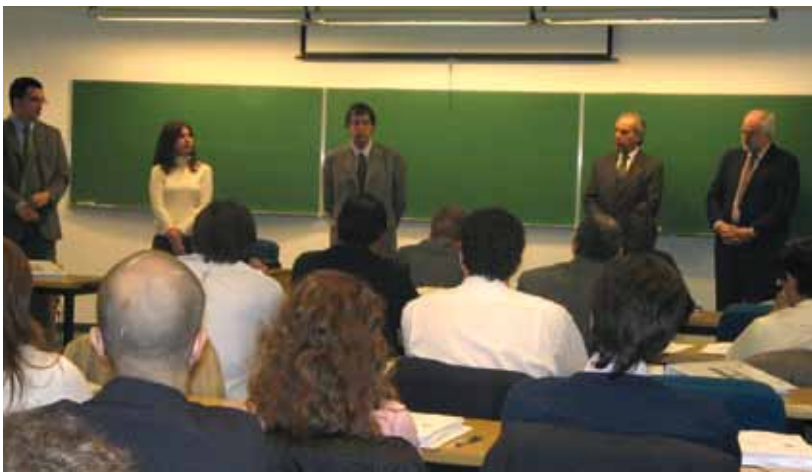
3ª Edición del Programa Ejecutivo en Política, Gobierno y Administración, en la UCA.

El Instituto de Ciencias Políticas y Relaciones Internacionales (ICPRI) organiza varios programas de extensión para formación y capacitación de funcionarios públicos. Muchos llevan años en marcha y suman más de 1.200 graduados.