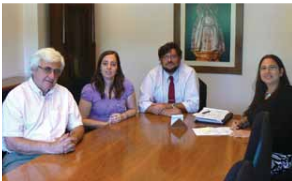
Representantes de Derecho y Ciencias Sociales con los auditores del IRAM.

mantenimiento realizada por IRAM, con la nueva versión de la Norma ISO 9001-2008. El Sistema de Gestión de Calidad (SGC) se implementó en 2005 con la participación de diferentes áreas de