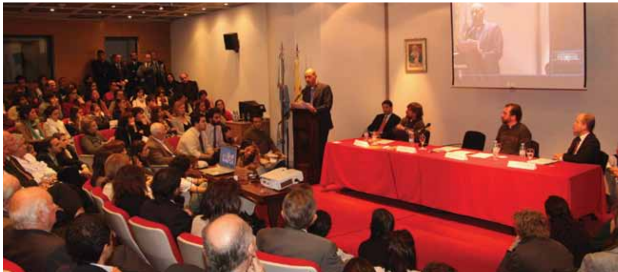
El Rector abre la reunión explicando las razones y los objetivos del acercamiento a las villas.