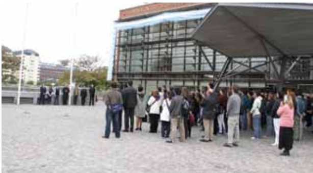
Izamiento de la Bandera en la explanada del Edificio Santa María.