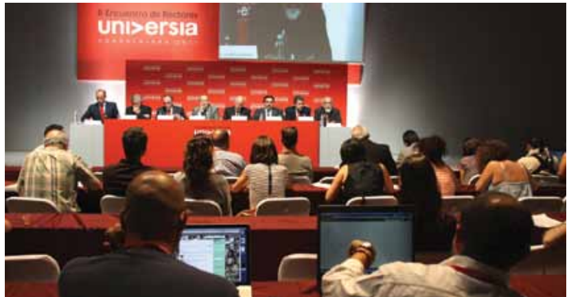
El conocimiento socialmente responsable fue el lema convocante.

En las conclusiones, los rectores valoraron el papel estratégico que corresponde a las universidades en la sociedad, donde la educación y el conocimiento son los instrumentos más poderosos de transformación y progre-