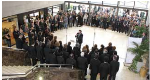
El hall central del Edificio Santa María enmarcó la actuación del Coro.

logren los resultados esperados, el solo hecho de salir de sí mismos para buscar algo grande junto con otro, ya es un triunfo del Espíritu.”.