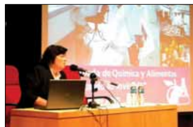
La 2da Jornada de Química y Alimentos reunió a expertos e industrias.

La Jornada, de carácter abierto y gratuito, contó con la asistencia de 300 participantes y tuvo por finalidad perfeccionar el conocimiento sobre los alimentos y la química en la región. Este objetivo fue alcanzado con creces, ya que el encuentro permitió compartir y cotejar experiencias con el fin de comprometer a las empresas e industrias alimenticias a obrar con responsabilidad en beneficio de todos.