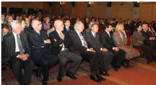
Vista del Auditorio San Agustín durante la Misa de Acción de Gracias.

El segundo día del Triduo Celebratorio estuvo dedicado a la inauguración de la segunda muestra del Pabellón del Bicentenario: “Escenas del campo argentino. Fotografías de Francisco Ayerza (1860-1901)”, con obras de la colección del reconocido fotógrafo Aldo Sessa y de la Academia Nacional de Bellas Artes, piezas que originalmente fueron pensadas para ilustrar una edición del Martín Fierro que no llegó a publicarse. La exposición tuvo como curadores al afamado Sessa y a