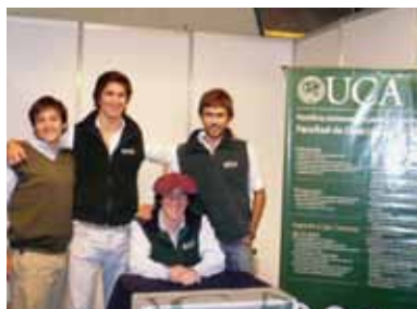
Estudiantes de Ciencias Agrarias en uno de los stands montados en la muestra.

Del 12 al 16 de mayo, la Facultad de Ciencias Agrarias de nuestra Universidad participó con dos stands institucionales en Mercoláctea 2010, la décima edición de la muestra lechera más importante de Latinoamérica. El evento se desarrolló en el predio de la Sociedad Rural de San Francisco, Córdoba, con la asistencia de todos los actores de la cadena láctica, incluyendo productores, empresas agropecuarias e industriales, hombres de negocios, profesionales, técnicos, estudiantes y público en general. Los dos stands atendidos por cuatro alumnos de Ciencias Agrarias difundieron las diferentes carreras y actividades de la UCA. Ubicados en los sectores Alimentario y Ganadero, los estudiantes fueron testigos de las numerosas personas que recorrieron la muestra y realizaron consultas. Como todos los años, se realizaron asimismo diferentes concursos. Entre ellos, el de Queso Nacional e Internacional, del cual participaron 197 quesos