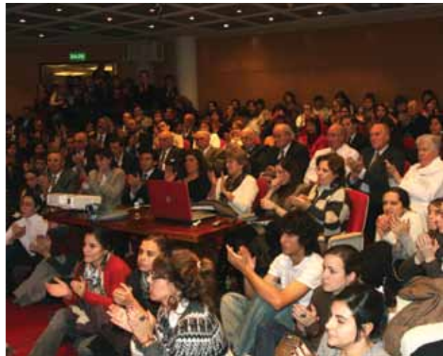
Representantes de toda la comunidad universitaria, sin distinción de funciones ni edades, participaron del encuentro en el Auditorio Monseñor Derisi.

injustificadas reiteradas y dificultades para reintegrarse, hasta que se produce el alejamiento definitivo. (...) Consideramos que la mejora en la calidad educativa de los adolescentes contribuirá no sólo a reducir las barreras y distancias sociales entre los jóvenes sino también, de este modo, a minimizar las desigualdades socio-económicas de la ciudad.” Dicho esto, pasó a comentar los proyectos mencionados, que son los siguientes: