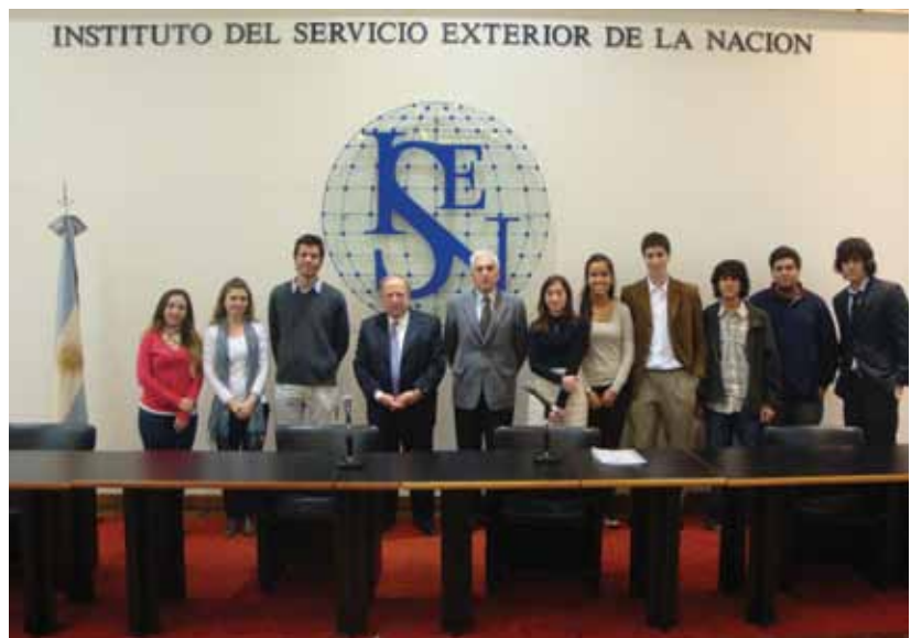
Miembros de la Comisión de Derecho Internacional Público del Centro de Estudiantes de Derecho se entrevistaron con el Director del ISEN.