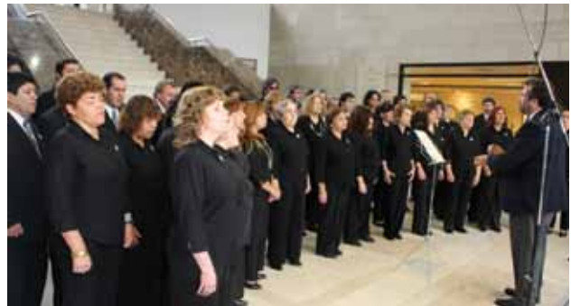
El Coro Polifónico Nacional de Ciegos interpreta obras populares.