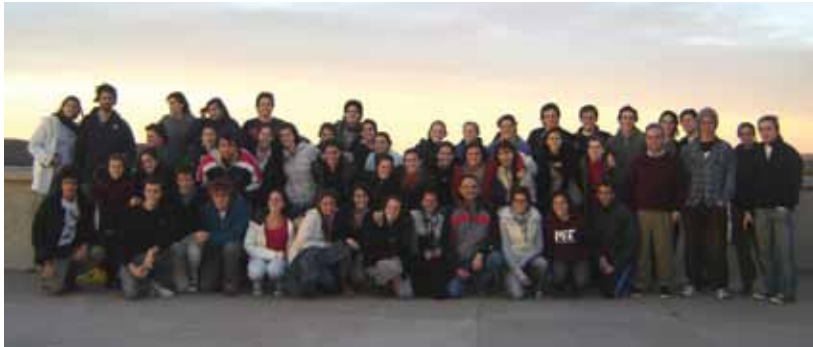
Conocieron industrias y los problemas sociales y ambientales.