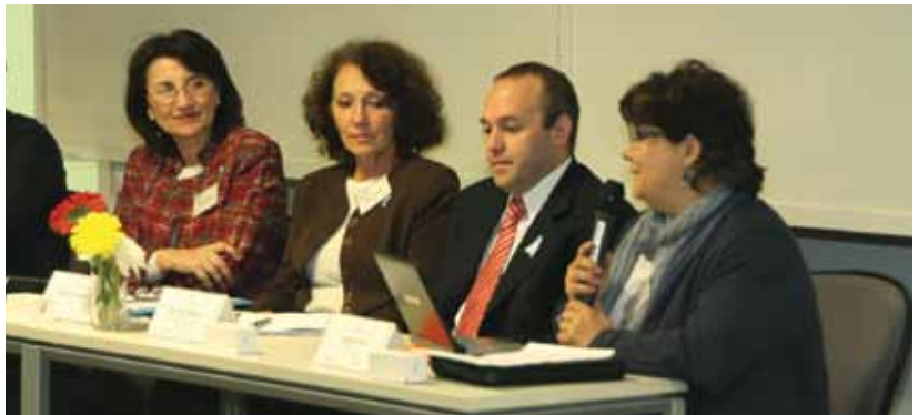
El Taller Nacional permitió difundir y debatir los resultados de la investigación.

Para su realización se llevan a cabo diferentes actividades, entre las cuales pueden mencionarse la aplicación de distintos tipos de encuestas, focus groups y estudios de caso con instancias de acompañamiento de un Consejo Asesor. En Argentina, se realizaron encuestas y talleres regionales y temáticos en distintas provincias y el Comité Asesor se conformó con 19 representantes de diferentes sectores.