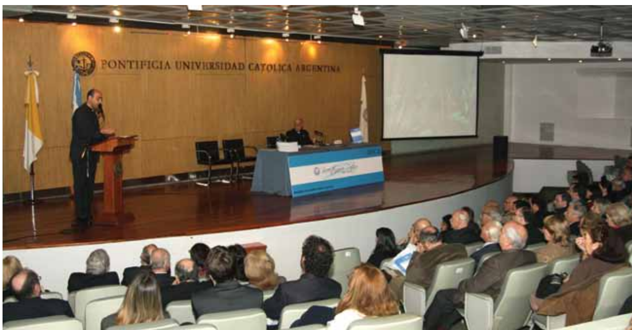
El Rector de la UCA y el Presidente de la Comisión Bicentenario inauguran el Triduo Celebratorio presentando las Actas del Congreso “Hacia el Bicentenario. 2010-2016”.