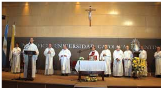
El Rector y los sacerdotes presentes participaron de la celebración.