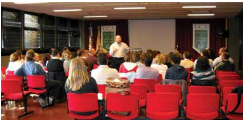
El representante de una de las entidades beneficiadas expone la tarea que ésta desarrolla.

Mediante un convenio marco y específico, la Facultad de Ciencias Agrarias colabora y realiza actividades conjuntas con el programa. Por ello, la idea