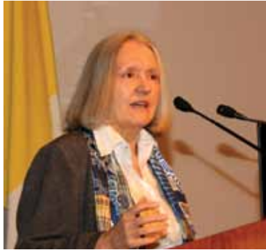
La Prof. Sassen detalla las nuevas lógicas de expulsión social.

El coloquio, que contó con el auspicio de los ministerios nacionales de Desarrollo Social, de Educación y de Trabajo, Empleo y Seguridad Social, así como de la Secretaría de Derechos Humanos de la Nación y del Ministerio