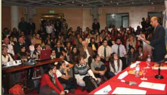
El Rector habla en el Auditorio Mons. Derisi, colmado por los asistentes.

En ciertos ámbitos ilustrados católicos, se percibe una gran